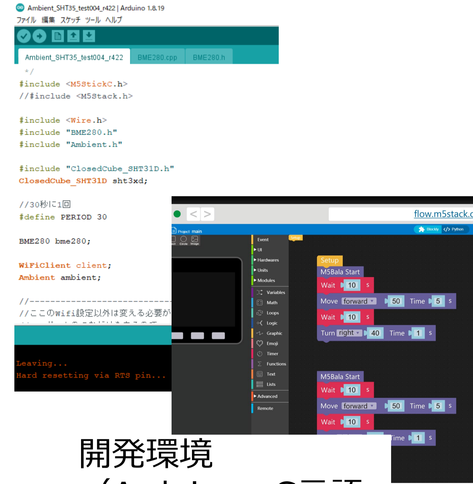
開発環境 (Arduino : C言語 UIFlow:GUI)