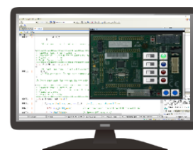
ディスプレイ2 実習用