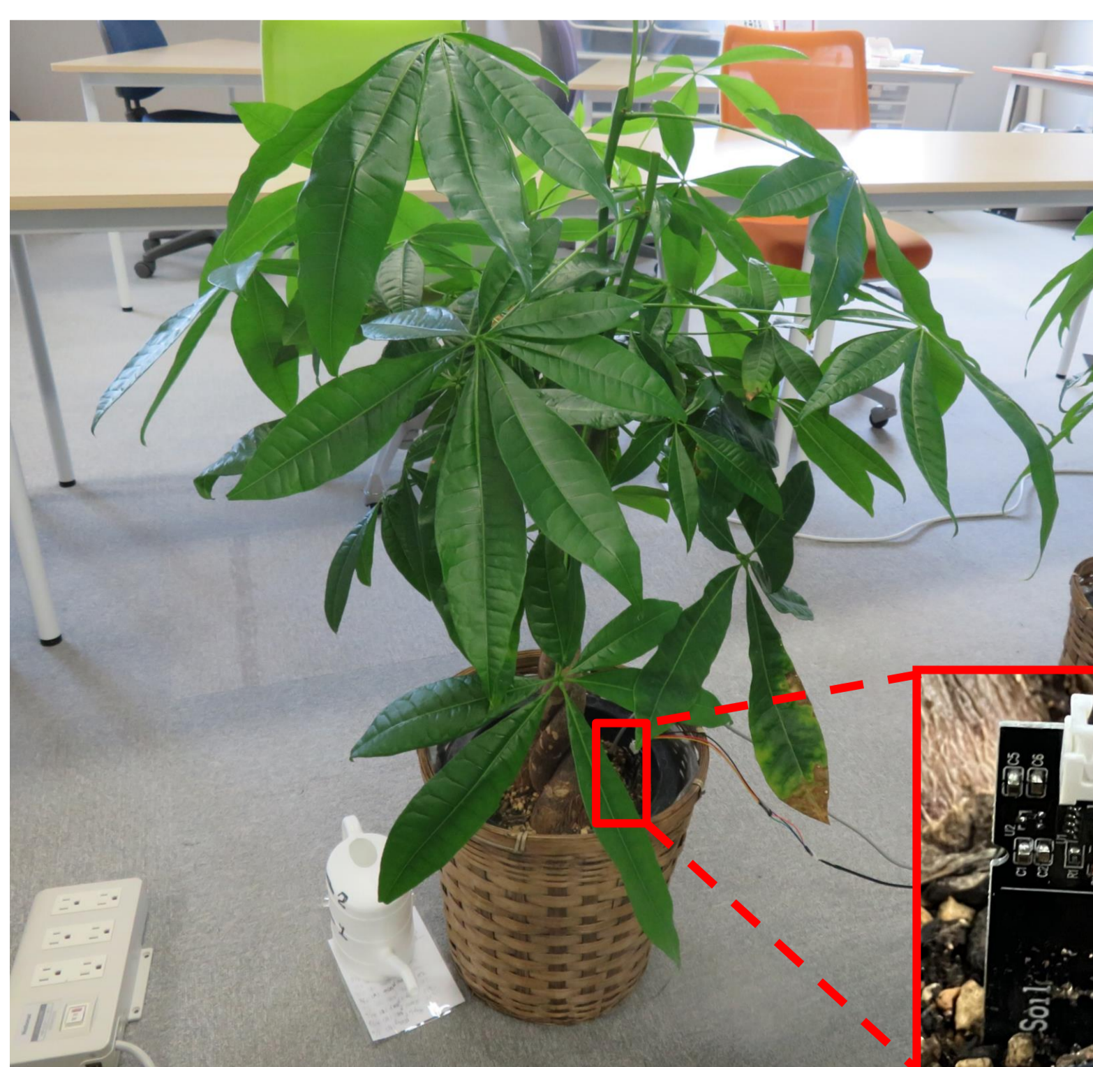
観葉植物 水分センサ