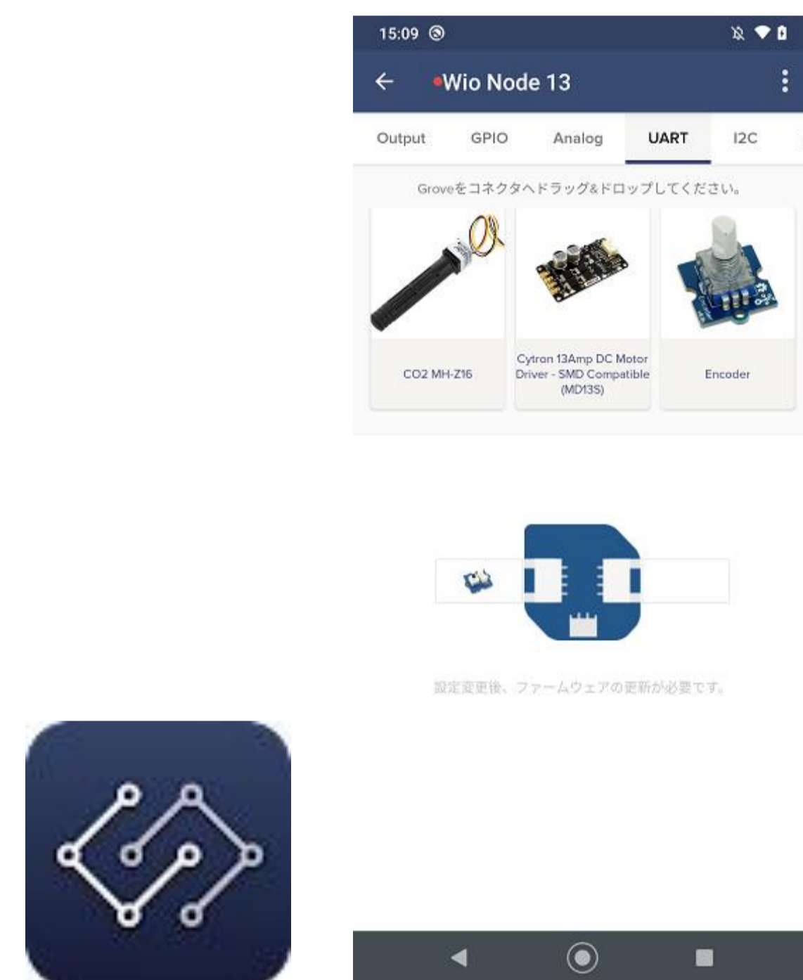
スマートフォン画面 (Wio Link Android App)