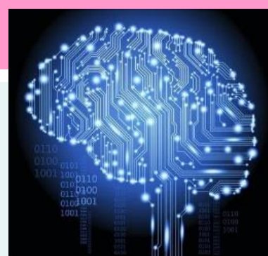
実装した3つのAI手法