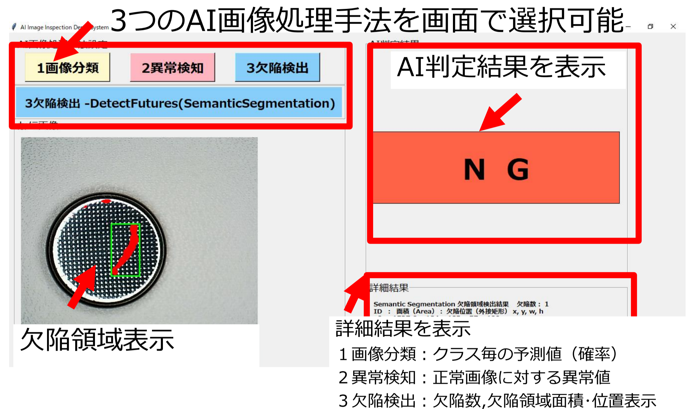
構築したデモシステムの外観（左：ハードウェア、右：ソフトウェア）