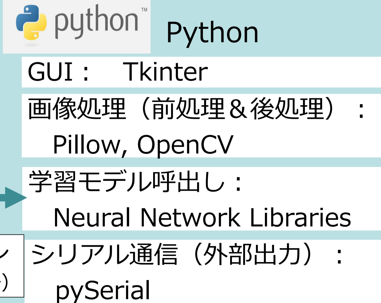
使用したツール・ライブラリ等