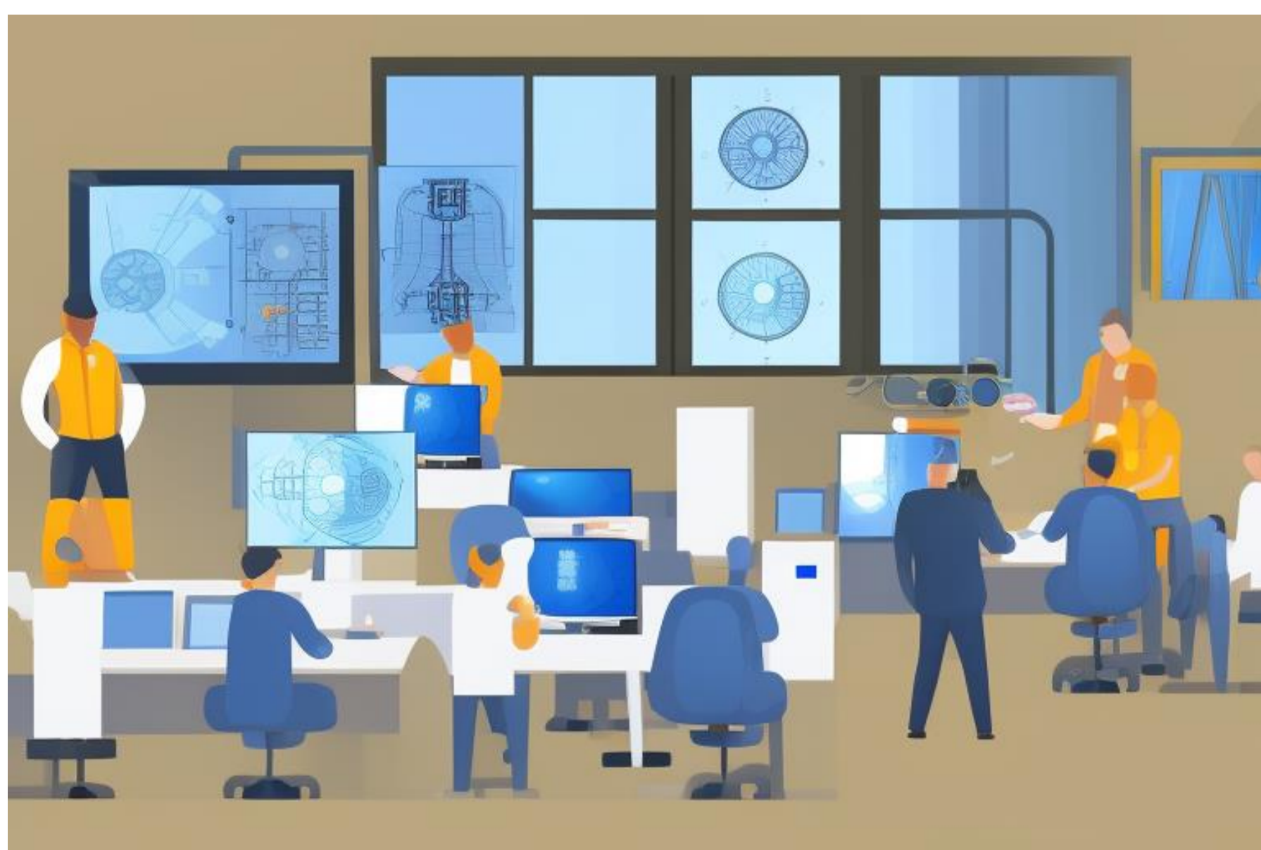
セミナー告知に使用した画像