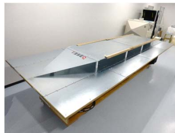
ストリップライン試験 (ISO11452-5)