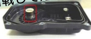
(a) 燃料弁 (自動車)