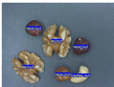
ナッツ類の検出・分類

持参された画像や製品から学習を行い, その場で効果を検証いただけます。使用後, 判定結果の画像をお渡しします。